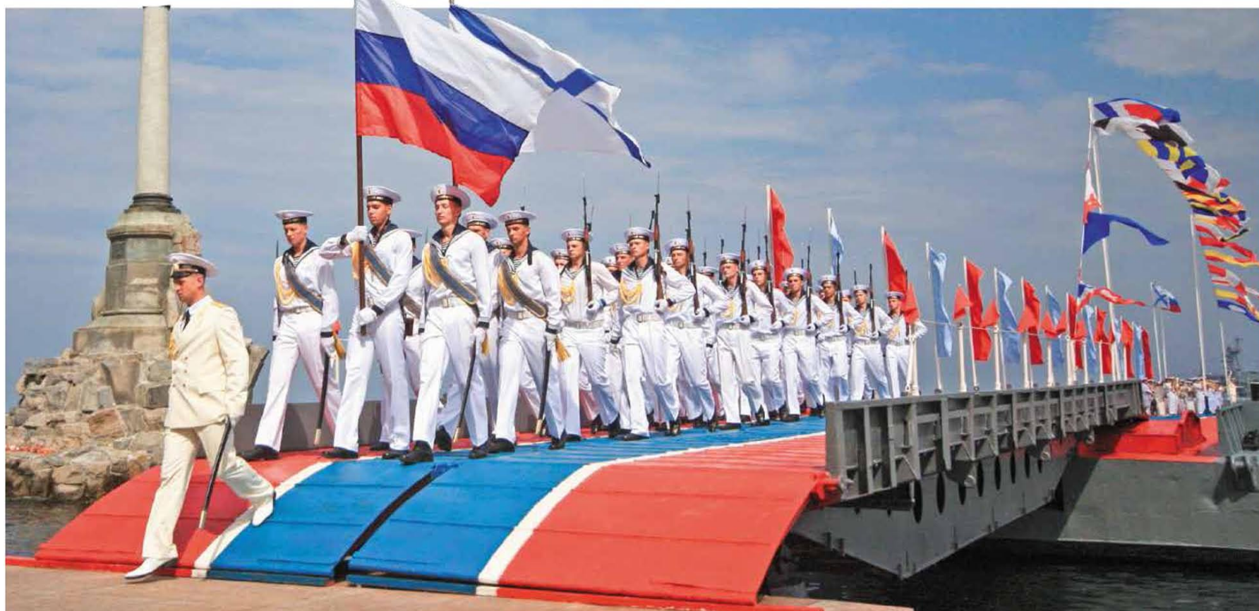
На военно-морском параде Черноморского флота в Севастополе

Ситуация, конечно, была очень напряжённой. Я только тогда почувствовал некоторые молитвы за богослужением, которые читал уже много-много лет, — те, где мы просим об избавлении от нападения вражия, от мора, язвы, труса, потопа, огня, меча, нашествия иноплемennых, от междоусобной брани. Казалось, это было в какие-то незапамятные времена, а тут читаешь и осознаёшь, что искренне молишься именно об этом, чтобы здесь этого не произошло. В Севастополе уже были конфликты, когда при Ющенко с Западной Украины приезжали люди и провоцировали драки. Здесь были побоища, которые в СМИ не показывали, — местные ребята изгоняли всю эту братию.