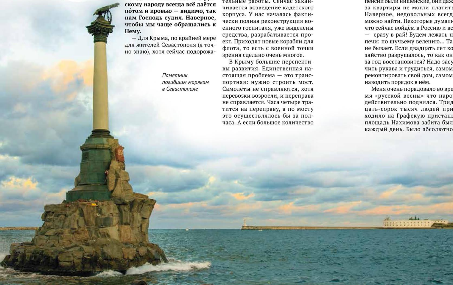
Памятник погибшим морякам в Севастополе